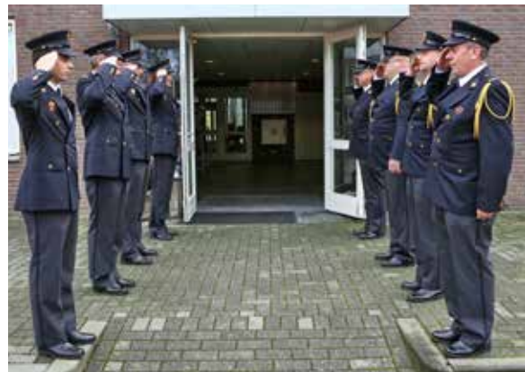
Afbeelding 5A en 5B: Erehaag buiten

In geval van een uitvaart met brandweerbetrokkenheid is voor de bloemendragers het dragen van witte handschoenen toegestaan, maar niet verplicht. Voor aankomst van de rouwstoet staan de bloemendragers en eventueel de draagploeg opgesteld op een door de