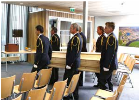
Afbeelding 6: Binnendragen van de kist