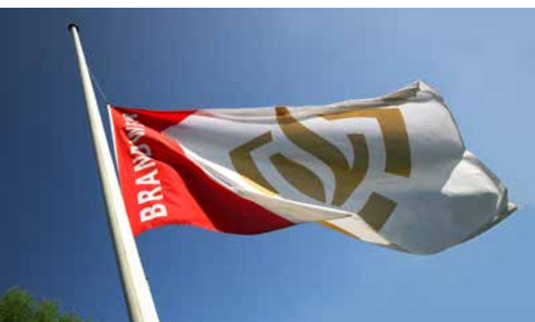
Afbeelding 3: Brandweervlag halfstok

In deze volgorde worden de vlaggen ook gehesen en gestreken.