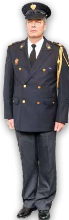
Afbeelding 1: Aannemen van de houding

Wanneer vanuit de rusthouding de houding wordt aangenomen, worden de voeten bij elkaar geschoven en wordt het lichaam gestrekt. De hakken van de schoenen staan tegen elkaar, de voeten iets uit elkaar. De armen zijn gestrekt langs het lichaam, waarbij de duimen van de gebalde vuist zijn geplaatst op de bies van de broek of de rok. Als de houding gelijktijdig door een groep brandweermensen moet worden aangenomen, kan er een zacht uitgesproken commando 'geeft ... acht' aan voorafgaan.