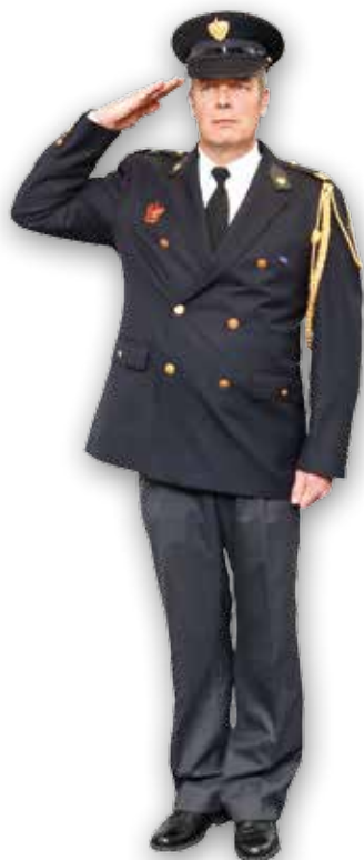
Afbeelding 2: Brengen van de groet

Wordt er gegroet zonder hoofddeksel, dan draag je de pet met de klep naar voren onder je linkerarm.