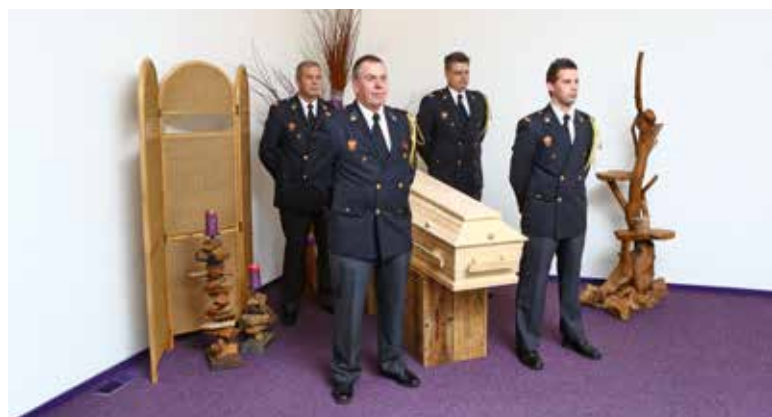
Afbeelding 4: Dodenwake

Afhankelijk van de (beperkingen van de) ruimte kan het voorkomen dat men hierin iets moet improviseren.