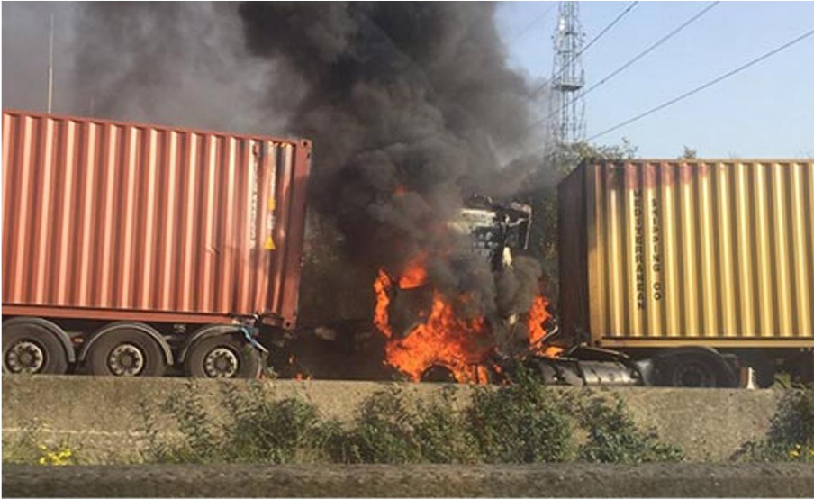
Brand LNG truck op de E313 België (oktober 2017)