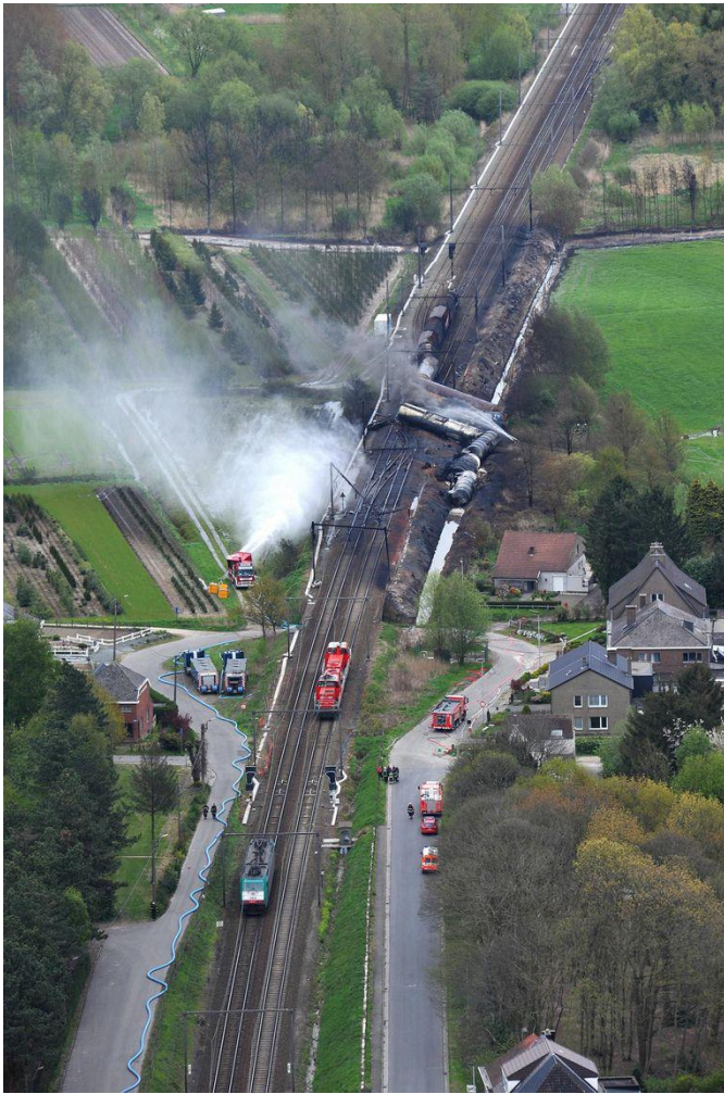
Treinramp gevaarlijke stoffen Wetteren - België (mei 2013)