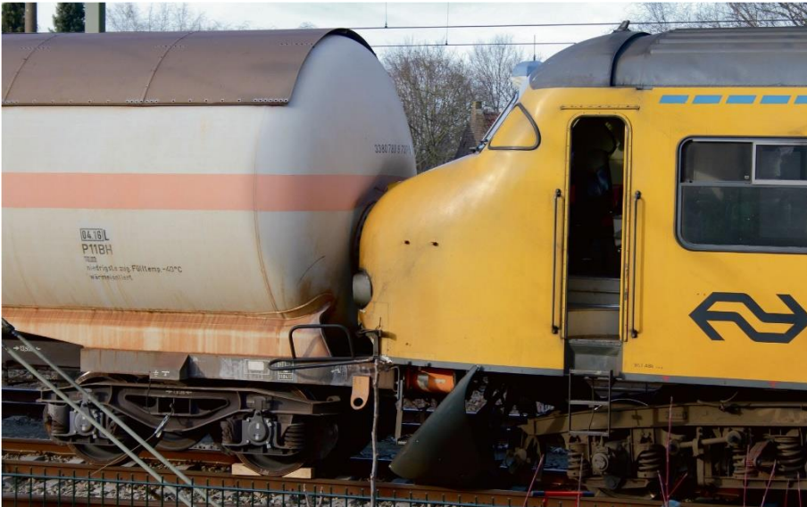
Botsing passagierstrein en wagon met gevaarlijke stoffen Tilburg (maart 2015)