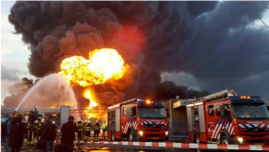
Brand Chemie-Pack Moerdijk (januari 2011)