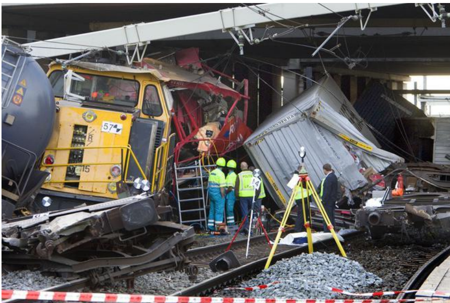
Treinramp Barendrecht (september 2009)