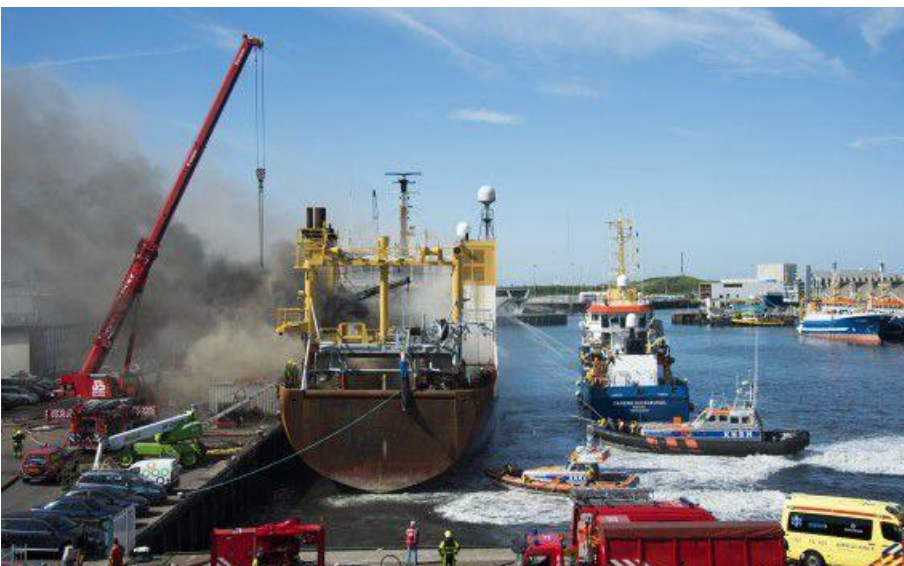
Brand visser trawler Scheveningen (juni 2014)